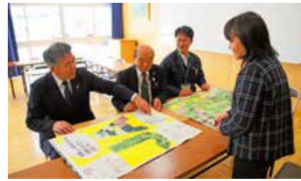
▲説明を受ける組合長