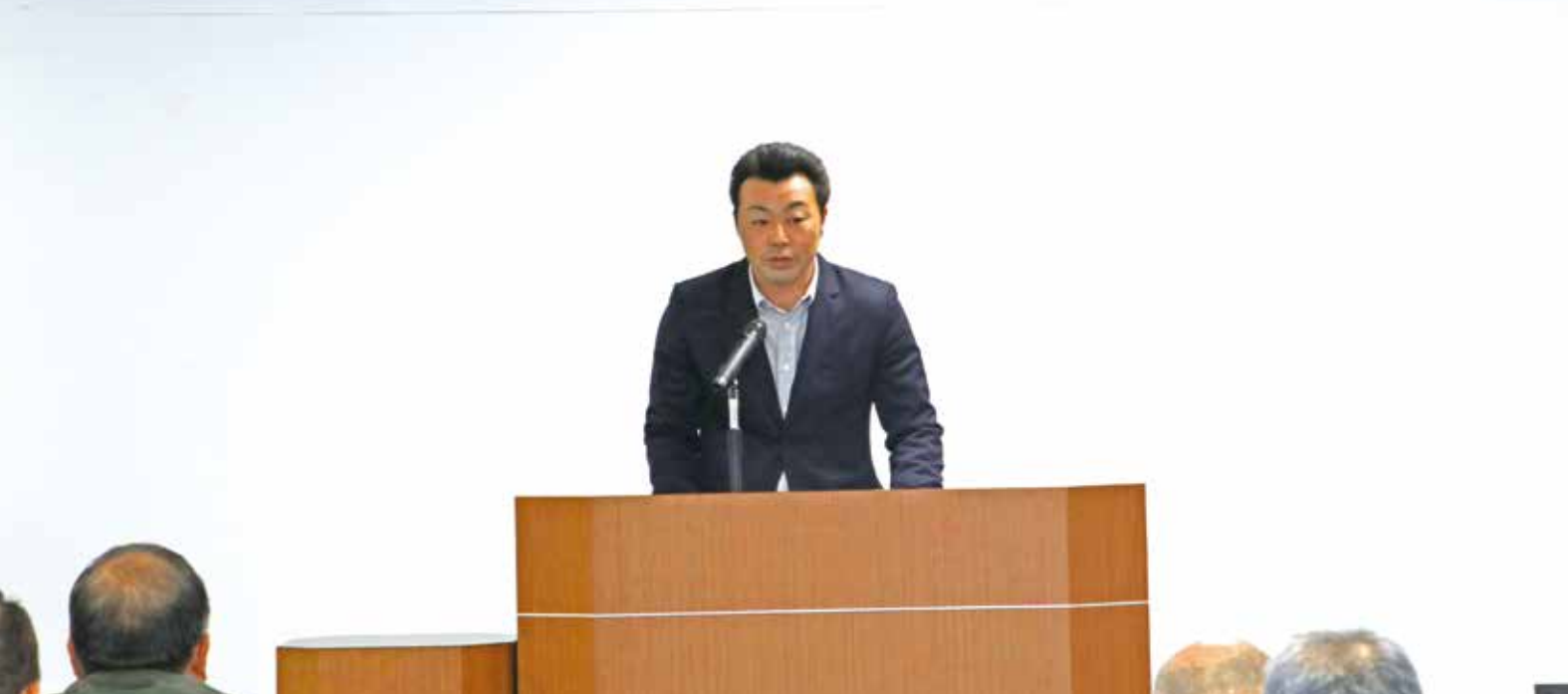
▲八鉾会長のあいさつ