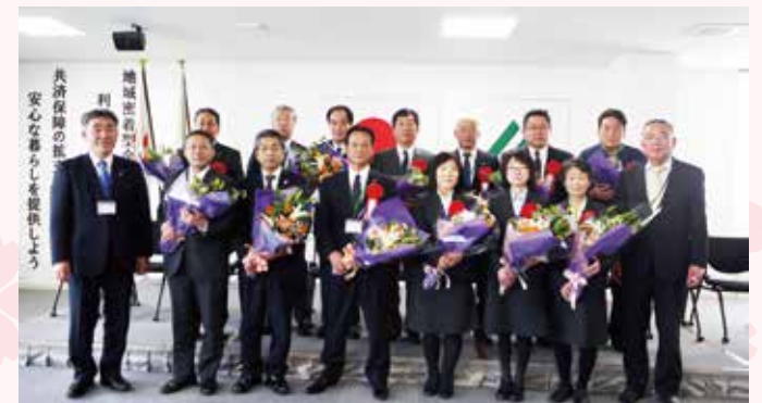
▲退職された皆さん