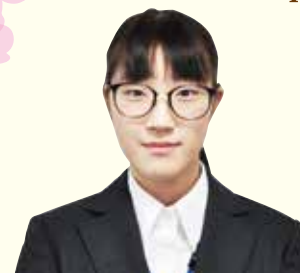
戸沢支店金融課金融係

4月より4名の新規採用職員が入組いたしました。 組合員の皆さまに親しまれる職員を目指し 頑張りますので宜しくお願いいたします。