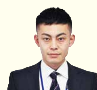
大豊管農センター 管農販売課販売係