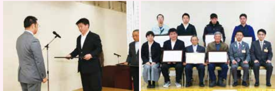
▲参加された受賞者の皆さん