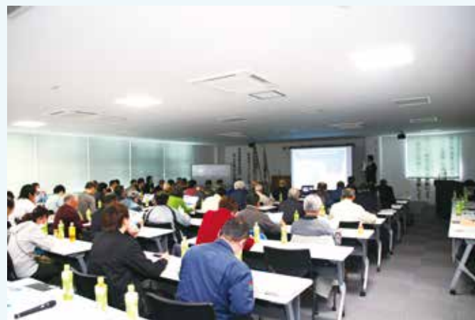
▲メーカーによる新農薬の紹介

最上広域野菜振興協議会ねぎ部会は、一大産地となっている最上地域のねぎを、更に大きい産地へ成長させるために技術レベルを上げ、レベルの高い技術の習得を目的とし、3月11日、JAおいしいもがみ本店で第一回最上広域ねぎ産地づくりプロジェクト研修会が開催されました。最上地域内の生産者や行政JA関係者など約70人が出席。