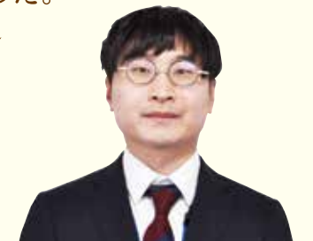
東部管農センター 購買課購買係