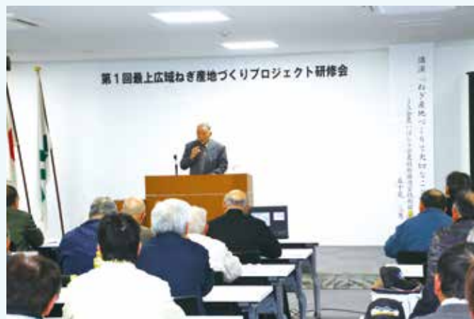
▲JA全農いばらき五十嵐技術顧問の講演