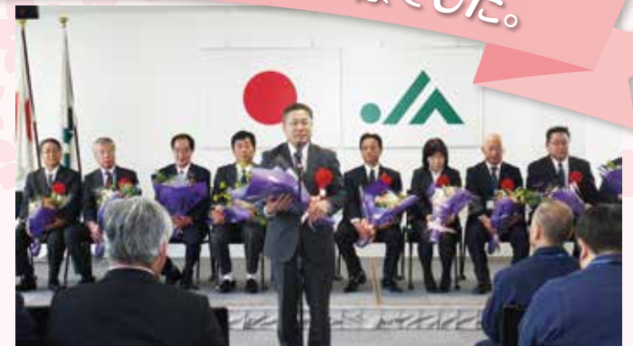
▲退職セレモニーの様子