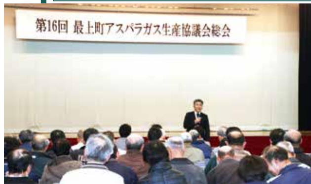
▲安食組合長の挨拶