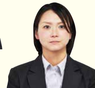
大豊支店共済課共済係