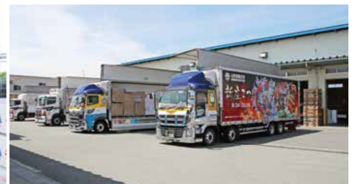
▲鮭川販売センター