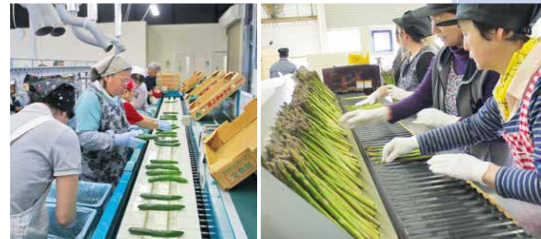
▲大豊きゅうり選果場