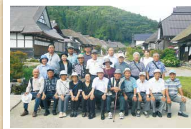
舟形・最上支部合同 9月5～6日 23名参加 福島会津若松 芦ノ牧温泉～大内宿 白虎隊記念館