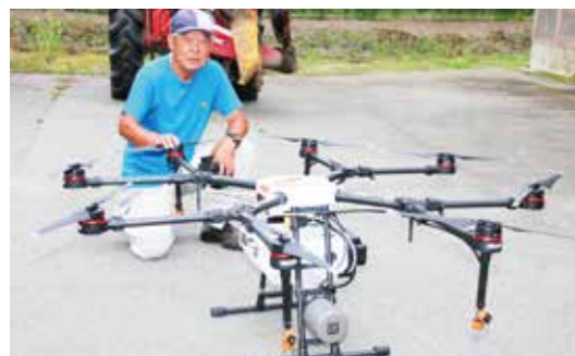
今年からドローンを導入