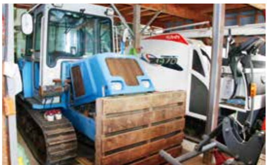
農業機械が大好き