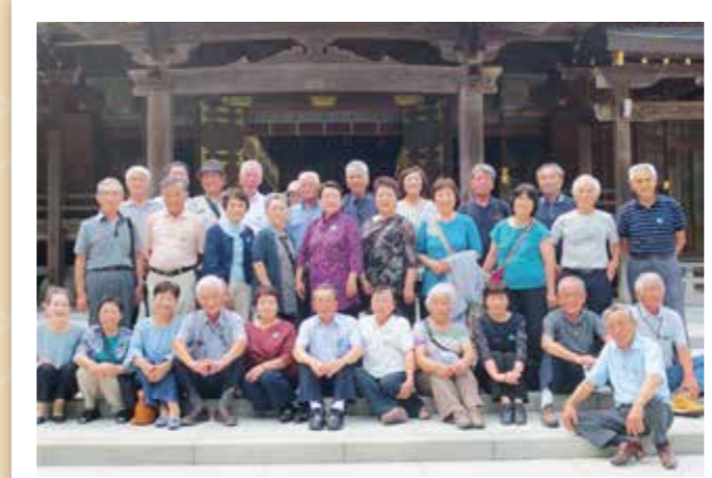
萩野支部 9月5～6日 33名参加 新潟 寺泊岬温泉～福島会津若松

今年も恒例の年金友の会親睦旅行が、各支部で開催されました。多数の参加ありがとうございました。