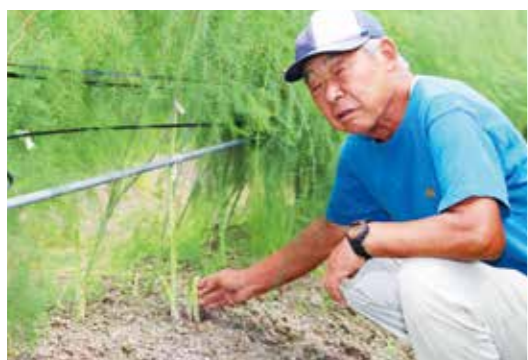
アスパラガス栽培歴は16年