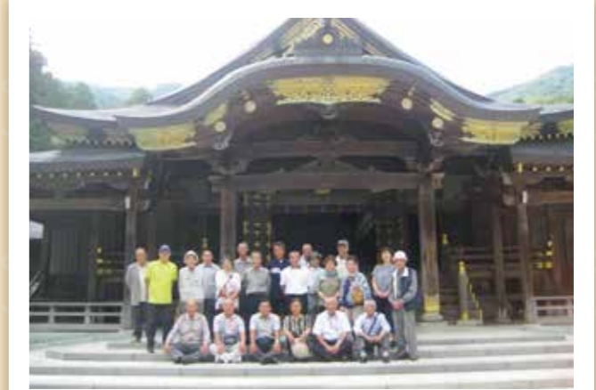
大蔵支部 9月5～6日 26名参加 新潟 寺泊岬温泉～福島会津若松