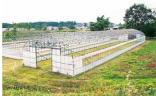
育苗ハウスは3棟保有