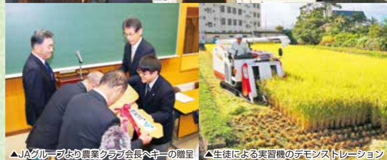
▲JAグループより農業クラブ会長へキーの贈呈