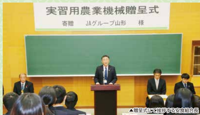
▲贈呈式にて挨拶する安食組合長