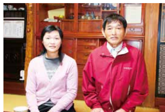
ニラの生産は夫婦で二人三脚