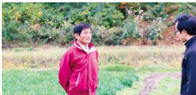
JA 指導員との情報交換は欠かせない