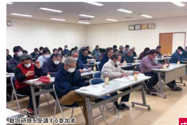
栽培研修を受講する参加者