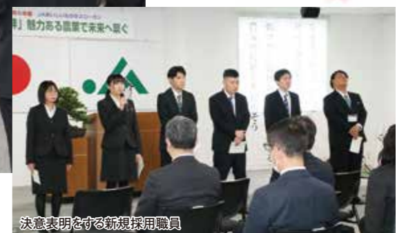
決意表明をする新規採用職員

4月より6名の新規採用職員が入組しました。組合員の皆さまに親しまれる職員を目指し頑張りますのでよろしくお願いいたします。