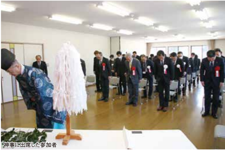
神事に出席した参加者