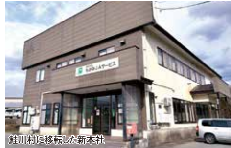
鮭川村に移転した新本社