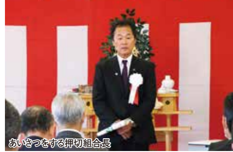
あいさつをする押切組合長