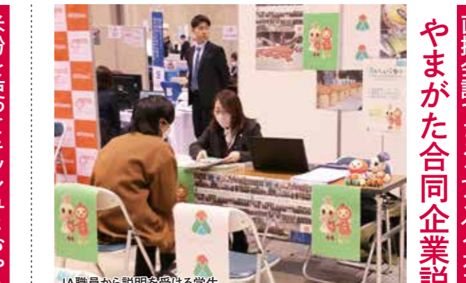
JA職員から説明を受ける学生

女性部真室川支部 米粉料理講習会 米粉を使ってキッチンとおやきを調理 3月12日、女性部真室川支部は真室川町の農家民宿・果菜里庵(かなりあん)で米粉料理講習会を開催し、部員8人が参加しました。 この日は、米粉を使用してキッチンとおやきを調理しました。レシピのポイントを話し合い、手際よく完成させました。部員は完成した料理を試食しながら、次回に向けたレシピのアイデアを話し合いました。 おやきを調理する部員