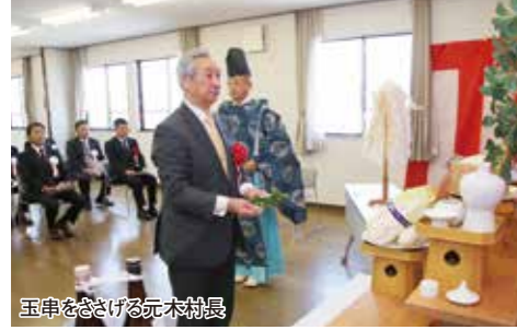
玉串をさげる元木副社長